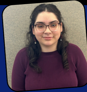
Justine Gomez Plans Examiner

¡Los servicios de desarrollo siempre están creciendo y estamos ansiosos por ver qué aportan estos nuevos empleados!